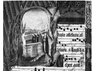
Les Femmes au tombeau.

Le Christ, «premier né d'entre les morts» (Col 1, 18), est le principe de notre propre Résurrection, dès maintenant par la justification de notre âme (cf. Rm 6, 4), plus tard par la vivification de notre corps (cf. Rm 8, 11).