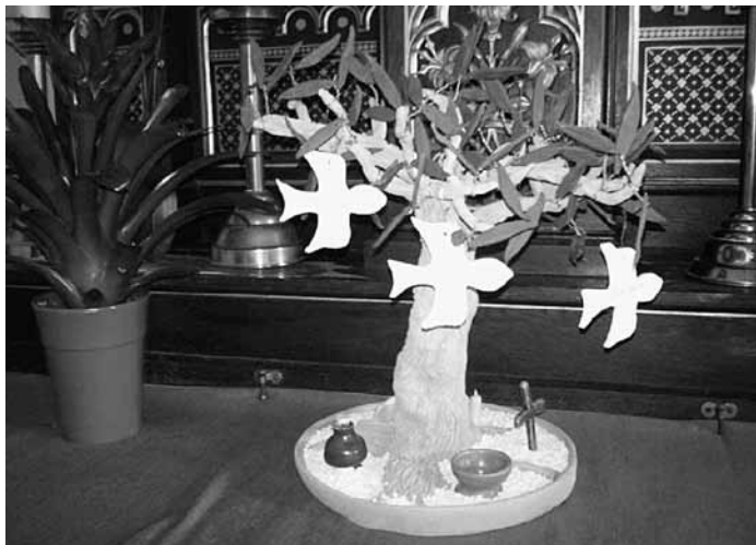
L'arbre en céramique réalisé par Christian Moullet. Au pied, les symboles du Baptême : la croix, le saint chrême, l'eau et la lumière.

Peut-être l'avez-vous remarqué : un phénomène écologique particulier vient de faire son apparition dans les églises paroissiales de notre Unité pastorale ! En effet, que ce soit près du baptistère ou plus discrètement au fond de l'église, un arbre (peint, en patchwork, avec de vraies branches et un feuillage brillant ou en tissus, en peinture ou en céramique), portant au bout de ses branches (ou suspendues à un clou...) de petites colombes, a « poussé » à l'église ! Ne vous inquiétez pas : pas besoin d'appeler M. Jardinier : il s'agit simplement de l'arbre des Baptêmes.