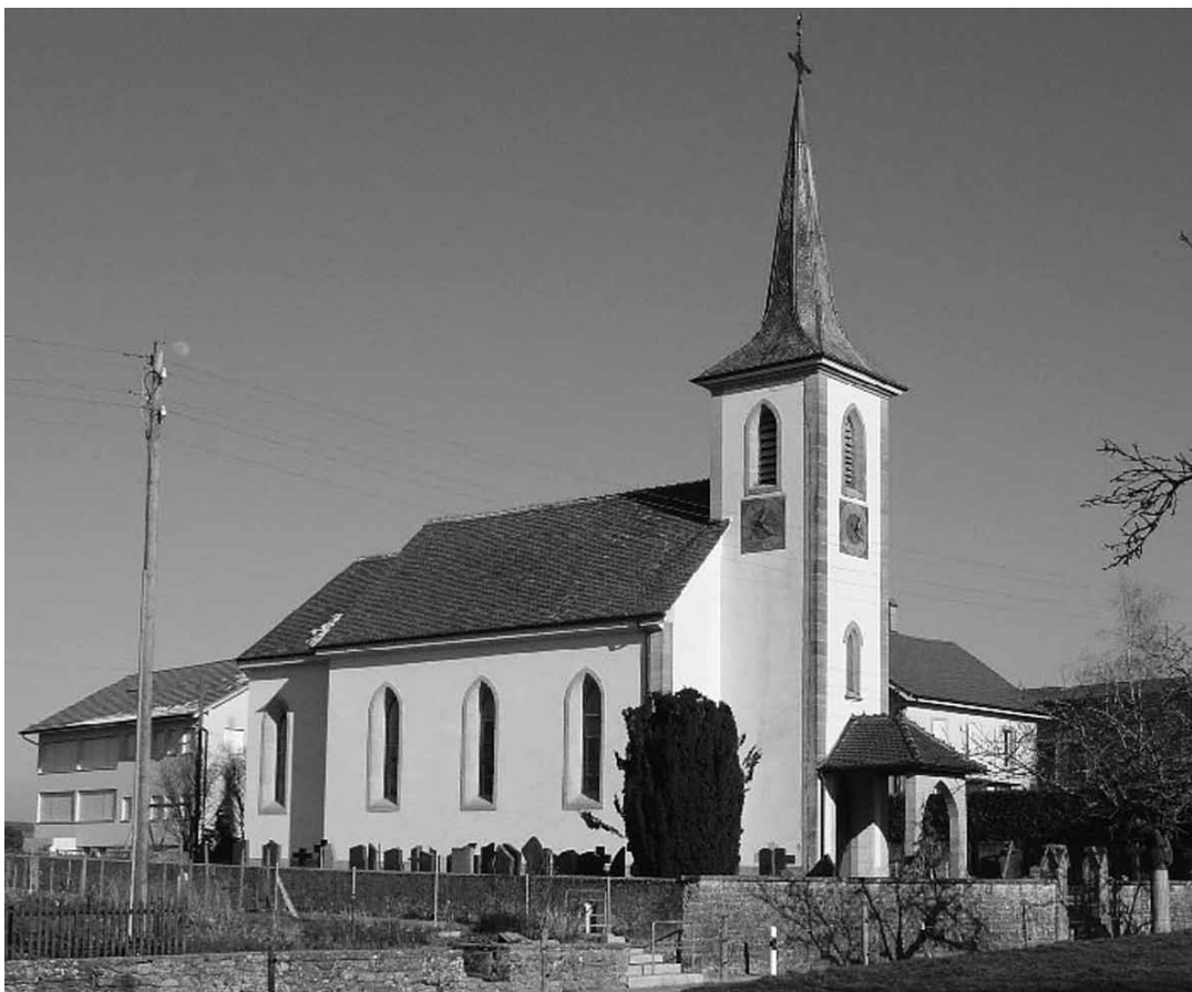
L'église de Seiry, dédiée à saint Georges.